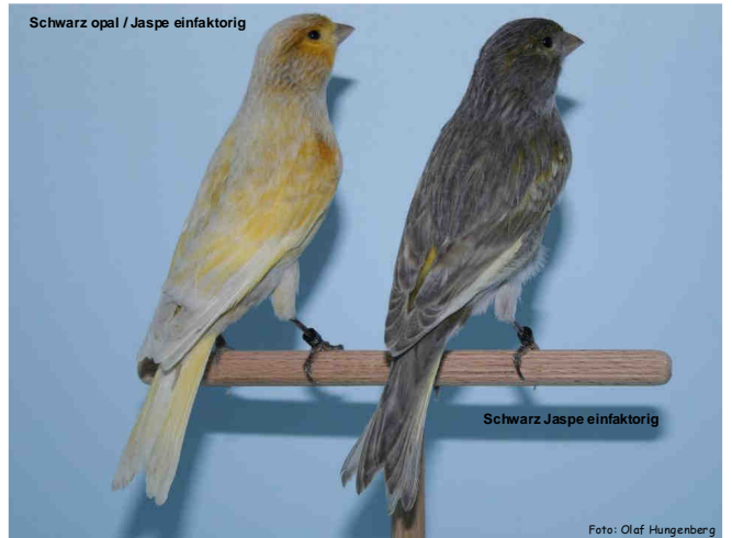
Direkter Vergleich Jaspe einfaktorig <-> Graufügel