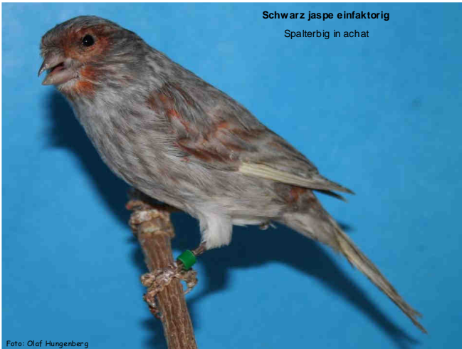
Schwarz jasper einfaktorig Spalterbig in achat