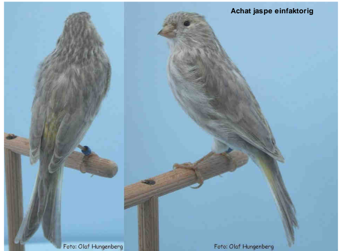
Achat jasper einfaktorig