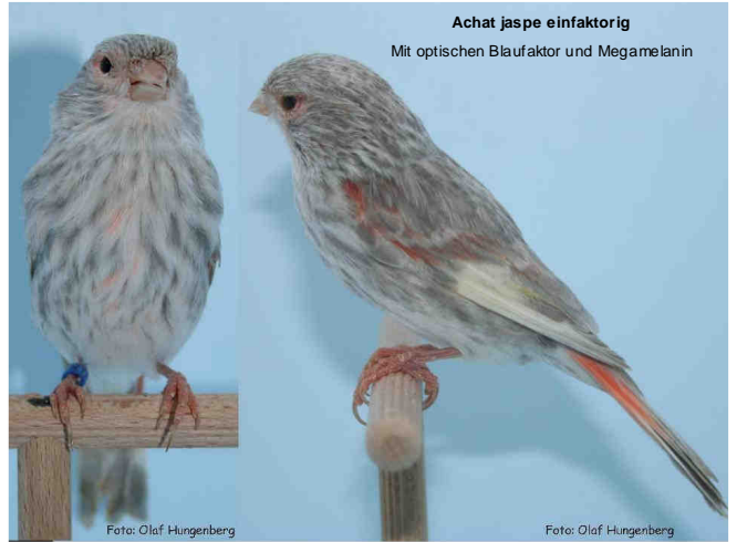
Achat jasper einfaktorig Mit optischen Blaufaktor und Megamelanin